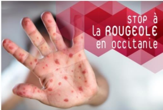
Stop à la rougeole en Occitanie

La Semaine de la vaccination (SEV) a été créée en 2005 par l'Organisation mondiale de la santé (OMS). Elle se déroule aujourd'hui dans près de 200 pays dans le monde. La date en est fixée par l'OMS, généralement en avril.